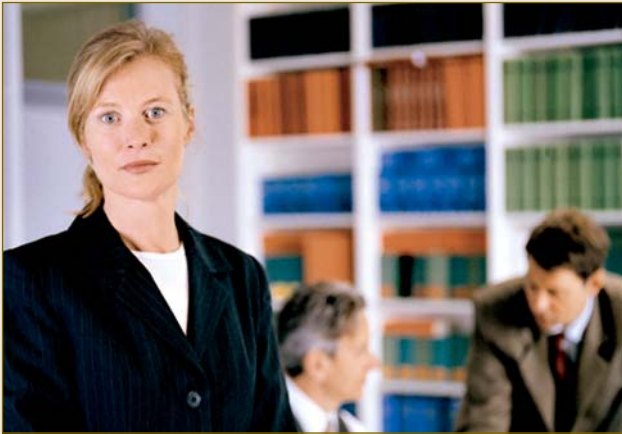
Deutsche Juristen: Experten für Vertragsgestaltung.