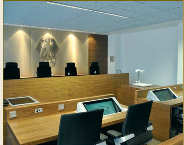
Bundespatentgericht in München.

Disputes in courts not only centre around legal questions but, first and foremost, around questions of fact .