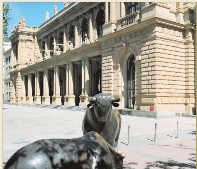
FIAC – Frankfurt International Arbitration Center in der Industrie- und Handelskammer Frankfurt.

Es steht den Parteien frei, Regeln über die Beweiserhebung zu vereinbaren oder dem Verfahren international anerkannte Regelwerke über die Beweiserhebung zu Grunde zu legen. Dem deutschen Schiedsverfahrensrecht sind zeit- und damit kostenintensive Vorverfahren zur Beweiserhebung fremd. Dies reduziert im internationalen Vergleich die durchschnittliche Verfahrens-