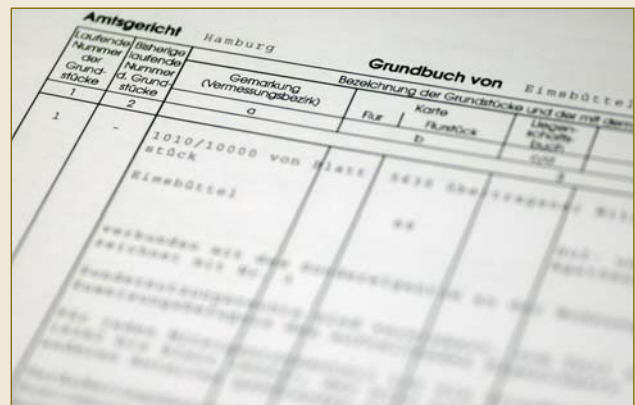
All information about owners as well as encumbrances on property is being held in the modern, electronic land register – reliably and securely!

With mortgage bonds (Pfandbriefe) , the German jurisdiction has provided the banking sector with an internationally recognised and legally certain refinancing tool.