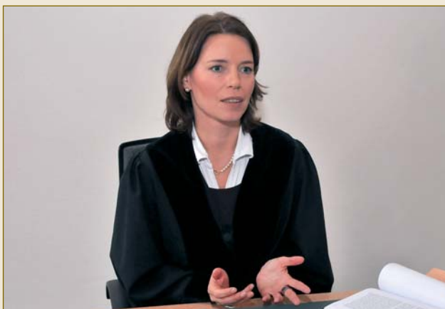
Führt durch den Prozess: die deutsche Richterin. Steering the proceeding – the German judge.

Deutsche Gerichte arbeiten äußerst effizient und schnell: Bei den Amtsgerichten (Streitwert bis 5.000 Euro) sind in Deutschland über 50 Prozent der Verfahren binnen drei Monaten abgeschlossen. Am Landgericht (Streitwert über 5.000 Euro) ist jedes dritte Verfahren innerhalb von drei Monaten beendet und weitere 25 Prozent nach spätestens sechs Monaten.