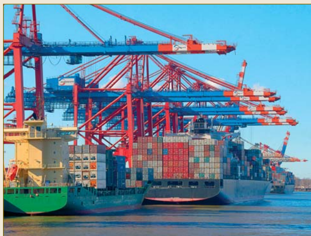
Gerade im internationalen Handel ist ein verlässliches Rechtssystem unerlässlich. A reliable legal system is indispensable, particularly for international trade.

Sicherungseigentum und Eigentumsvorbehalt sichern den Kreditgeber, obwohl er nicht oder nicht mehr im Besitz der Sache ist. Hier zeigt sich das deutsche Recht erheblich flexibler und effizienter als andere Rechtsordnungen, die Sicherungsrechte immer vom Besitz der Sache abhängig machen.