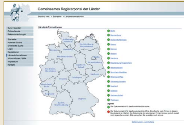
Für jedermann online zugänglich: das deutsche Handelsregister ( www.handelsregister.de ).

In Rechtsordnungen ohne zuverlässige Register muss die Vertretungsbefugnis von Gesellschaften regelmäßig von Anwälten überprüft und in so genannten Legal Opinions bescheinigt werden. Dies kann in den USA schnell bis zu fünfstelligen Dollarbeträge kosten.