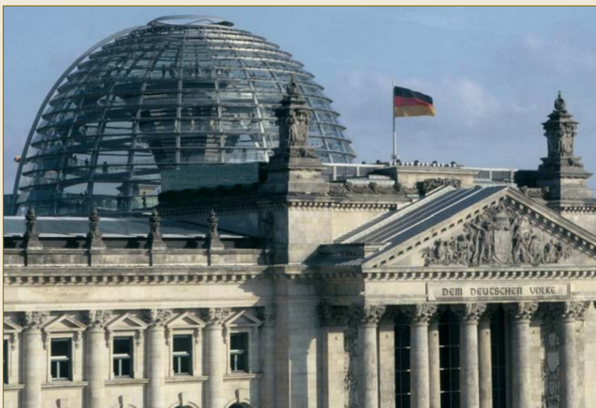
Law – Made in Germany: Der Deutsche Bundestag.

Als Unternehmer benötigen Sie gut ausgebildete Arbeitnehmer, eine leistungsstarke öffentliche Verwaltung, ein funktionierendes Bildungswesen, Straßen, Bahnhöfe und Flughäfen, vor allem aber auch eine funktionierende und berechenbare rechtliche Infrastruktur. Alle diese Rahmenbedingungen bietet Ihnen Deutschland in optimaler Weise.