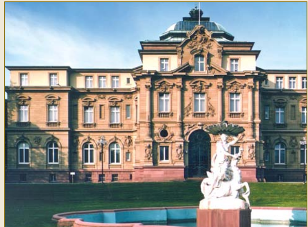
Der Bundesgerichtshof, das oberste deutsche Gericht in Zivilsachen.

Zur Berechenbarkeit deutscher Zivilprozesse trägt auch das deutsche Haftungsrecht bei. Extrem hohe Schadensersatzsummen, wie beispielsweise in den USA üblich, gibt es in Deutschland nicht. Auch der Gedanke eines „Strafschadens“ ist dem deutschen Recht, das lediglich den tatsächlich entstandenen Schaden ausgleicht, fremd. Als Unternehmen ist für Sie ein etwaiges Prozessrisiko daher sehr gut kalkulierbar .