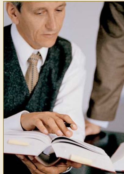
German lawyers: experts in drafting contracts.

The contract of manufacture , which is regulated in great detail in the Civil Code , provides clear rules for the contract drafter, taking into account the interests of both parties. These rules span the entire contractual process, from order placement through to