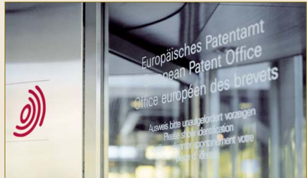
Das Europäische Patentamt in München: Hier ist Ihr geistiges Eigentum gut aufgehoben. The European Patent Office in Munich: safeguarding your intellectual property.

Diese klägerfreundliche Regelung und Handhabung zieht viele ausländische Kläger vor deutsche Gerichte. Die Kosten des deutschen Patentverfahrens sind begrenzt. Erstattungsfähig sind sie nur nach dem Streitwert mit einer Obergrenze von 30 Millionen Euro. Deutsche Gerichte sind zudem sehr zurückhaltend mit dem Ansatz hoher Streitwerte.