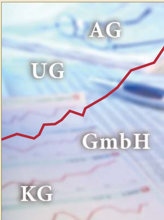
Deutsches Gesellschaftsrecht – international eine Erfolgsgeschichte. German company law – an international success story.

Das deutsche Handelsgesetzbuch regelt die Personenhandels-gesellschaften, von denen die Kommanditgesellschaft (KG) im Wirtschaftsverkehr am häufigsten anzutreffen ist. Insbesondere kleine und mittlere Unternehmen greifen auf diese Rechtsform zurück. Jede Kommanditgesellschaft besteht aus mindestens einem unbeschränkt haftenden Gesellschafter, der auch eine Kapitalgesellschaft sein kann, und einem oder mehreren Kommanditisten, deren Haftung auf ihre jeweilige Einlage beschränkt ist.