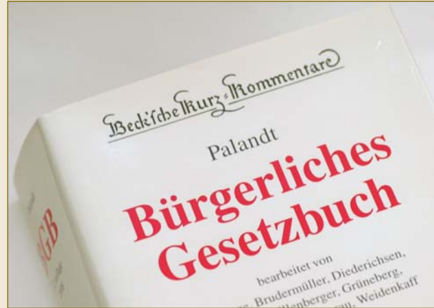
Commentary on the Civil Code: the entire court rulings at a glance.

German law is both predictable and reliable. The legislator sets the systemic and structural parameters, while lawyers and civil law notaries use the law to shape and organise specific situations.