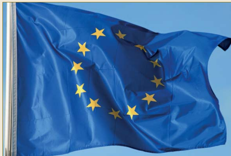
Das kontinentaleuropäische Recht – stark in Europa.

As an entrepreneur, you need highly qualified staff, efficient public administration, a functioning education system and the requisite infrastructure, such as roads, railway stations and airports. Most importantly, you need a functioning and predictable legal infrastructure. Germany more than meets all of these requirements.